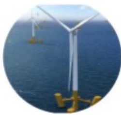
Parc éolien flottant de Groix

Atelier Ecocitoyenneté : le défi EcoWatt