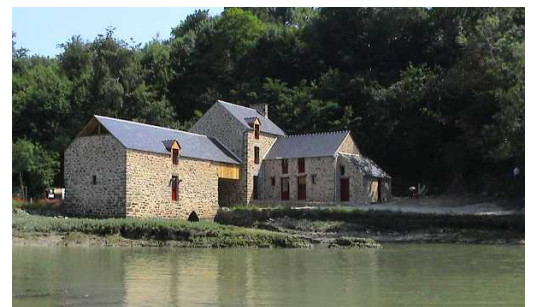
Le Moulin du Prat