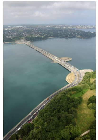
Usine marémotrice de La Rance