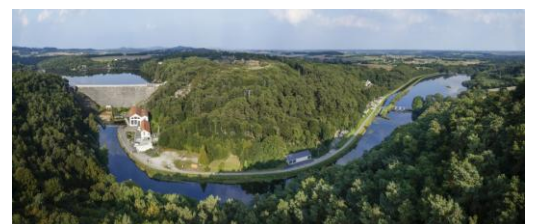
Barrage de Guerlédan