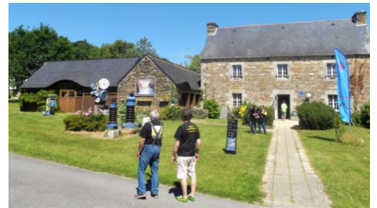
Le musée de l'électricité

Au cœur du village de Saint Aignan, le musée de l'électricité retrace l'histoire du barrage de Guerlédan et l'arrivée de l'électricité dans la région.