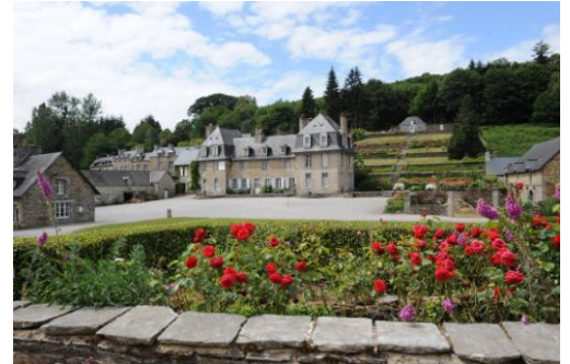
Les Forges des Salles

Au cœur de la grande forêt de Quénécan, à quelques kilomètres du lac de Guerlédan, se niche une des forges à bois les plus anciennes et les mieux préservées de Bretagne. Un vestige exceptionnel d'une activité prospère et industrielle pendant près de trois siècles. L'activité de la forge s'est arrêtée en 1877 mais le village a continué à vivre et le voici aujourd'hui entièrement restauré. Le Logis du maître de forges, la chapelle, l'école, la cantine, les ateliers des forgerons et le bâtiment du haut fourneau sont le témoignage éternel d'une vie ouvrière des 18 e et 19 e siècles.